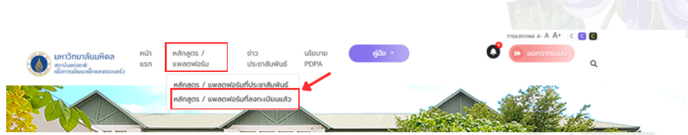
ภาพแสดงขั้นตอนการเข้าสู่เมนู “หลักสูตร / แพลตฟอร์มที่ลงทะเบียนแล้ว”