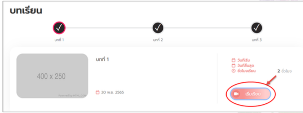
ภาพแสดงหน้าจอเข้าเรียนหลักสูตร