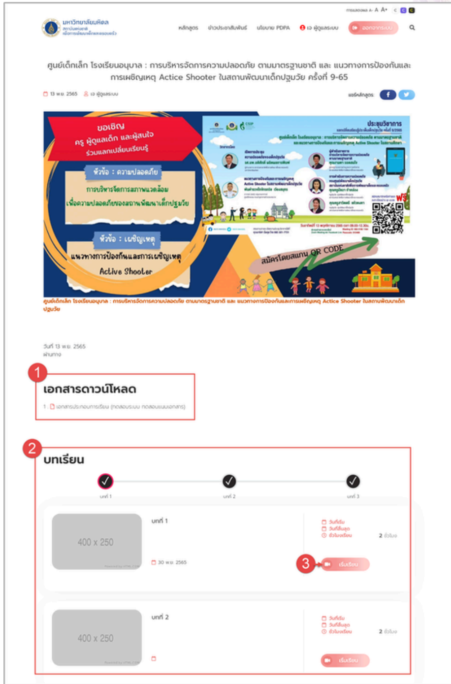
ภาพแสดงหน้าจอเข้าเรียนหลักสูตร